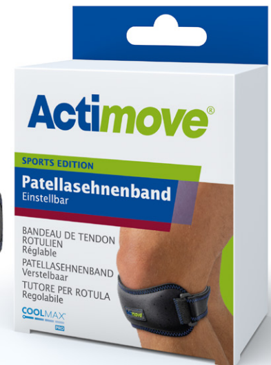
Voering met siliconen