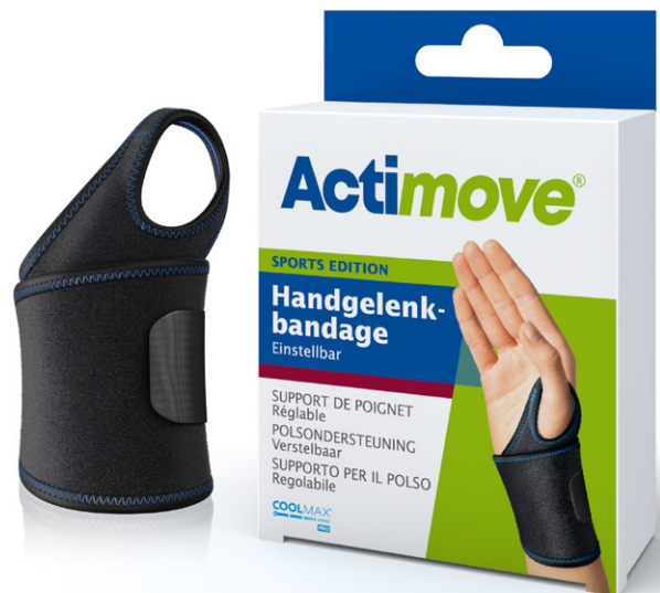
3D-Diamond voering met COOLMAX® AIR