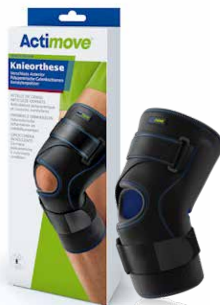
Uitneembare condyl pads Uitneembaar polycentrisch scharnier